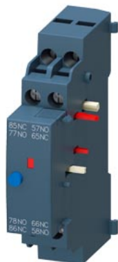
信号开关 用于断路器 3RV2 带螺栓型端子