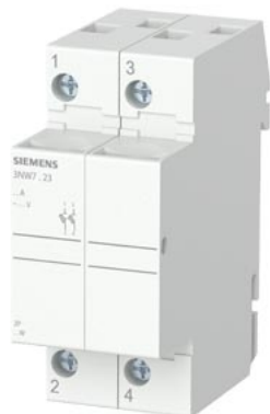
SENTRON, 柱状保险丝支架, 10x38 mm, 2 极, 内: 32 A, Un AC: 690 V