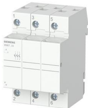
SENTRON, 柱状保险丝支架, 10x38 mm, 3 极, 内: 32 A, Un AC: 690 V