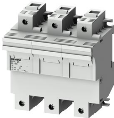
SENTRON, 柱状保险丝支架, 22x58 mm, 3 极, 内: 100 A, Un AC: 690 V