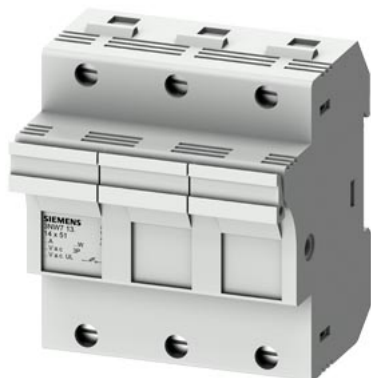
SENTRON, 柱状保险丝支架, 14x51 mm, 3 极, 内: 50 A, Un AC: 690 V