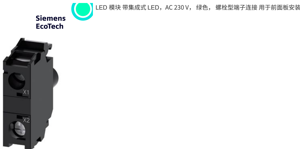
LED 模块 带集成式 LED, AC 230 V, 绿色, 螺栓型端子连接 用于前面板安装