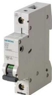
小型断路器 230/400V 6kA, 1 极, C, 6A