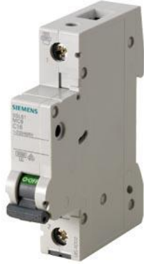
小型断路器 230/400V 6kA, 1 极, C, 32A