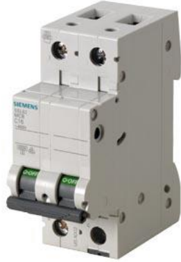
小型断路器 400V 6kA, 2 极, C, 6A