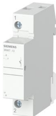
SETRON, 柱状保险丝支架, 10x38 mm, 1 极, 内: 32 A, Un AC: 690 V